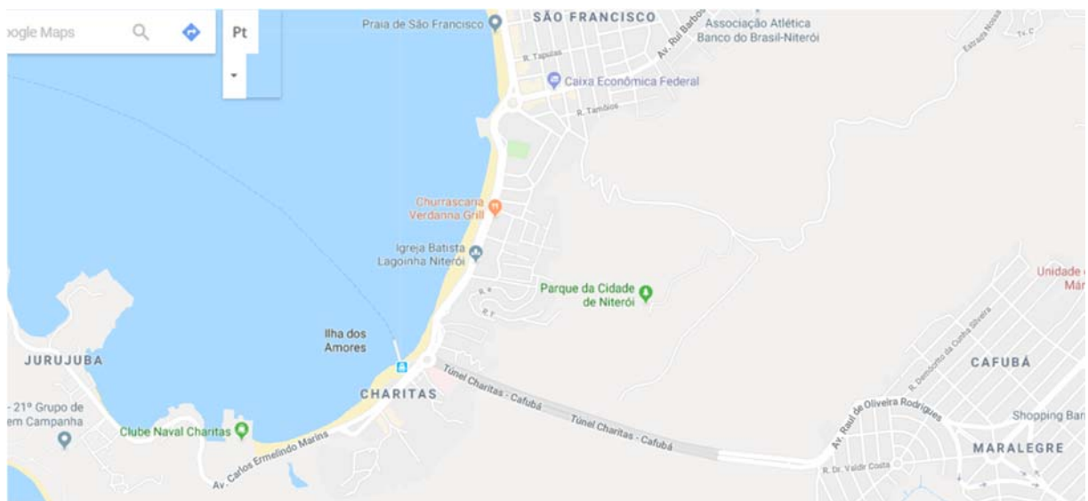
Figura 3: Mapa visto pelo Google indicando a ligação de Charitas pelo Túnel até o Cafubá.

O Preventório é uma favela de baixa renda da cidade de Niterói, Rio de Janeiro. Formou-se nos anos 1980, principalmente com a ocupação de parte do Morro da Viração, um grande maciço de pedra, em área de mata atlântica, de frente ao mar. O morro está inserido dentro do bairro de Charitas, área nobre com moradias de alto luxo, sendo identificadas como uma das áreas mais caras para se morar do estado do Rio de Janeiro e de alto interesse do mercado imobiliário e turístico.