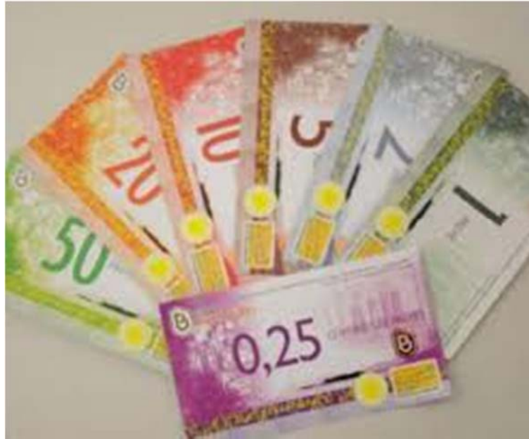
Figura 1: Moeda social Prevê.

extrema importância para o sucesso deste instrumento.