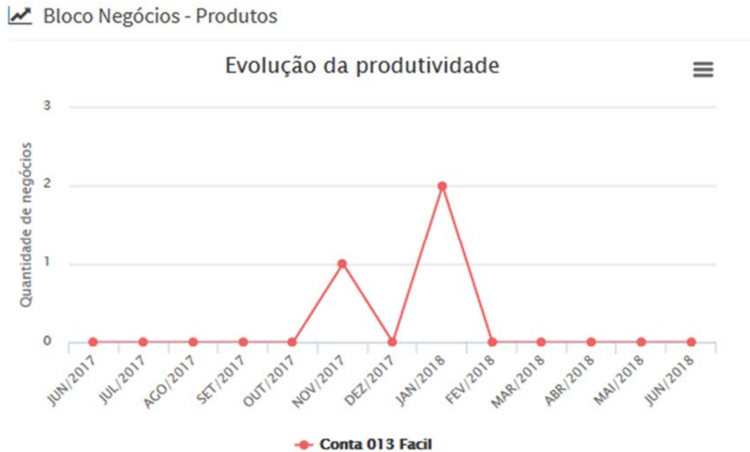
Figura 6: Abertura de contas poupanças.