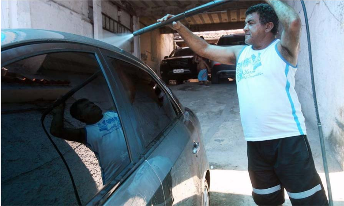
Figura 2: Prestador de serviço local tomador de microcrédito produtivo.