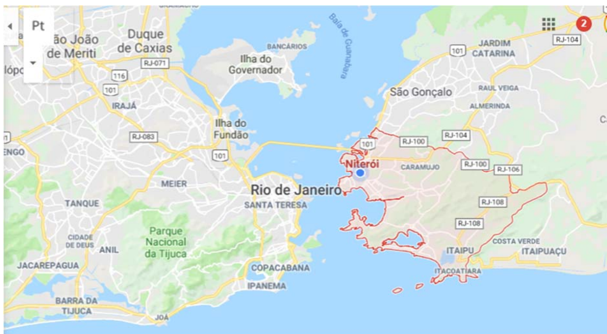
Figura 5: Cidade de Niterói, estado do Rio de Janeiro.

A fama de comunidade pacata permitiu que se desenvolvessem atividades de diversas ONGs e políticas públicas por um longo período no território. A Bem Tv Educação e Comunicação, Instituto Graef, Instituto Fernanda Keller são exemplos de organizações não governamentais que desenvolveram projetos sociais na comunidade. Além de políticas públicas como o Projovem, Protejo, Mulher da Paz e outras.