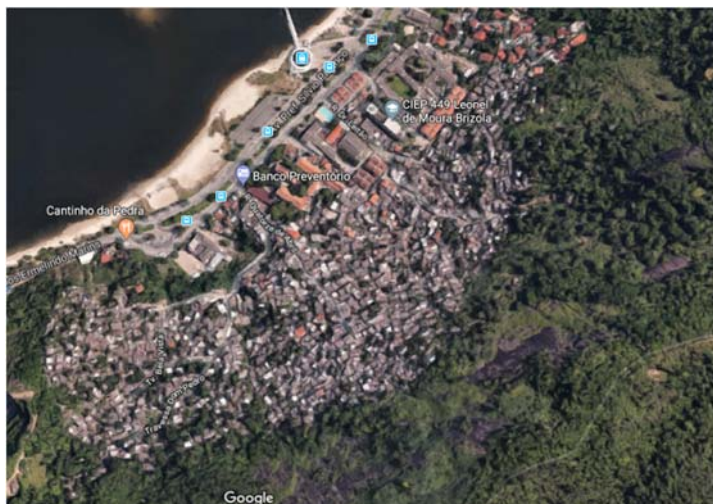
Figura 4: Morro do Preventório visto de cima pelo Google.